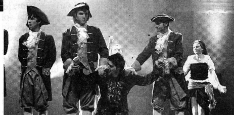
Nelle foto alcuni flash dei due spettacoli messi in scena sul palco del D'Annunzio

è stato proposto «Mary Poppins», con i più grandi «Il Re Sole». Mary Poppins è stato ambientato nella Londra dei primi anni del '900 dove vive la famiglia Banks. Il capo famiglia è George Banks, funzionario di banca severo e